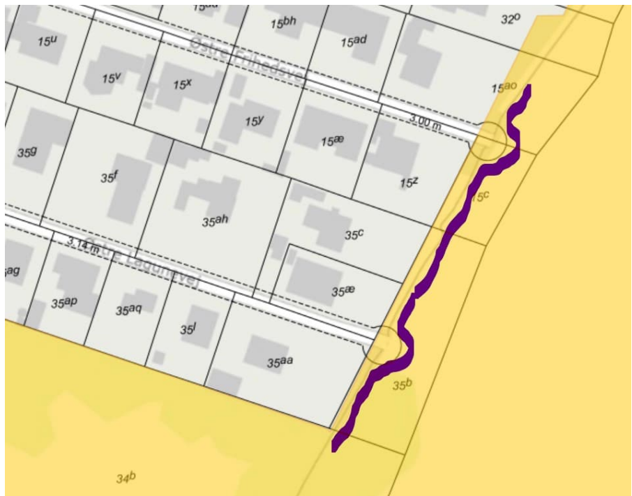
Nordlige ende af lagunen, huse (sandsynligvis i Solrød Strands Grundejerforening) med Natura 2000-linie gennem dagligstuen (Natura 2000 område med gult):